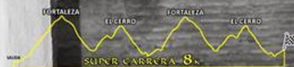
1er PREMIO CONCURSO FOTOGRAFICO CORRE TU HISTORIA 2017