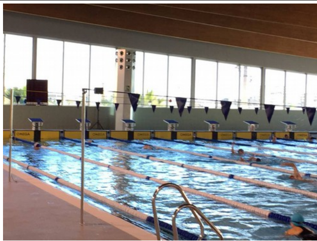
Vista zona salida nadadores.