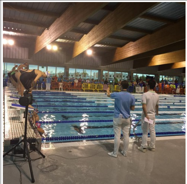
Vista general vallado de instalación en la parte lateral