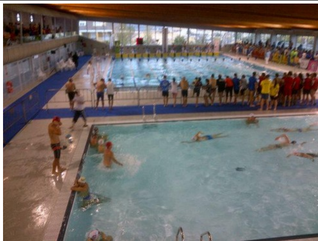
Vista general de la instalación con la ubicación de zonas protegidas con moqueta