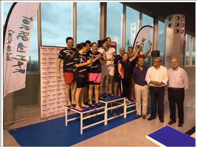
Podium de premiaciones