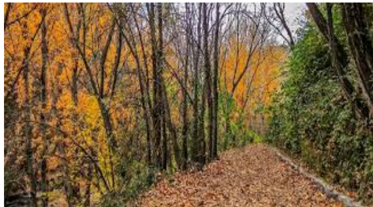
Sendero junto al río Genil