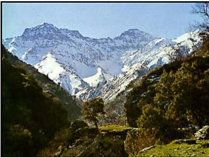
Vereda de la Estrella