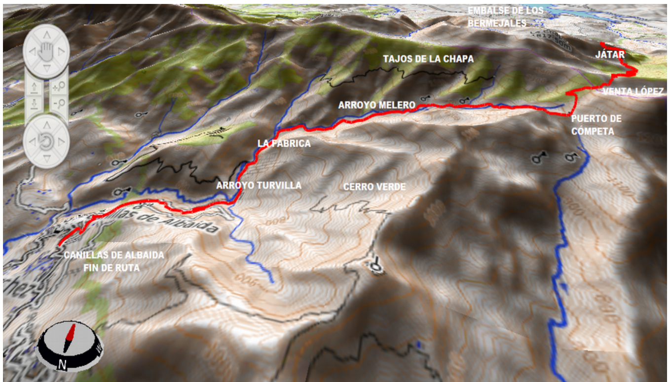
Track de la ruta en color rojo.