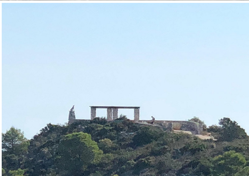
mirador del refugio del lobo.