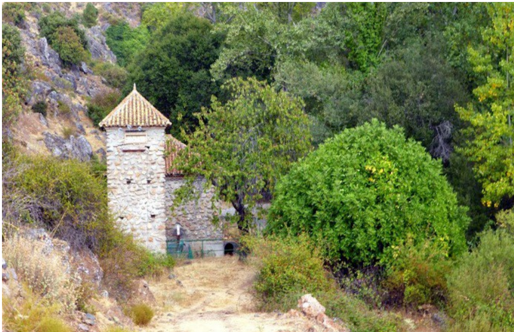
Toma del canal en el río Dílar