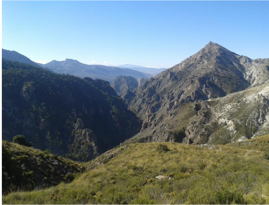
Barranco del Búho