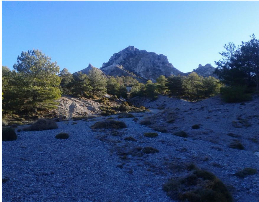
Los arenales y el Trevenque

Algunas fotos de la ruta que realizaremos.-