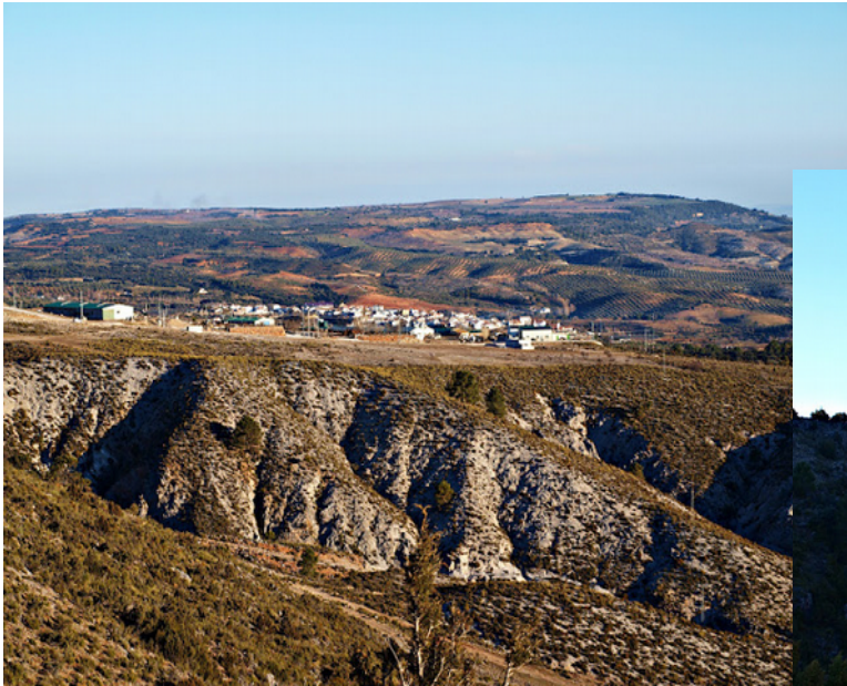
Játar al fondo.