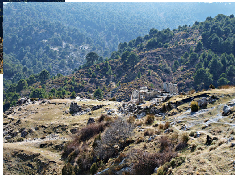
Lucero y Lucerillo.